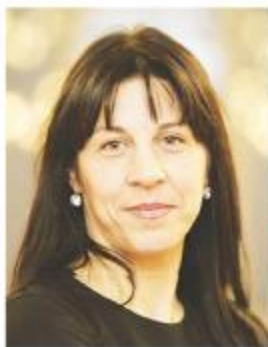
Piše: dr. Elizabeta Zirnstein

Sindikaliziranost v Švici je nizka. V sindikate je vključenih 21 odstotkov delovne populacije . 3 Posamezni sindikati so relativno avtonomni, organizirani pa so v konfederacije. Največja konfederacija je Švicarska konfederacija sindikatov (SGB), ki jo sestavlja 16 sindikatov, skupaj predstavljajo okoli 380.000 članov. Druga največja konfederacija je TravailSuisse, ki združuje 12 federacij sindikatov in 163.000 članov. Na drugi strani delodajalce zastopajo tri organizacije: Konfederacija švicarskih delodajalcev (SAV), Švicarska zbornica obrtnikov ter malih in srednjih podjetij (SGV) ter Združenje švicarskih podjetij (Economie-Suisse).