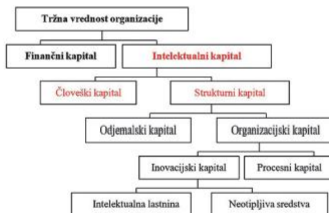
Slika 1: Intelektualni kapital organizacije