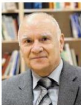
Piše: dr. Živko Bergant

darskih družb, občin do države), ki so lahko tudi neformalni, se presežna dodana vrednost namreč pojavlja v različnih pojavnih oblikah, saj se ustvarja v različnih trenutnih pravnih okvirih in organizacijskih kulturah. Zato se nujno razlikujejo tudi sodila delitve presežne dodane vrednosti. Na ta sodila pa pomembno vplivajo različne vrednote in cilji v različnih organizacijskih sistemih. Kljub temu je (oziroma naj bi bila) skupna značilnost teh sodil na ustrezen način ocenjen prispevek deležnikov k obvladovanju tveganj v najširšem smislu. 1