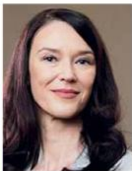
Piše: dr. Anja Strojín Štampar

je ZNS izbralo na podlagi javnega poziva članom k sodelovanju v delovni skupini.