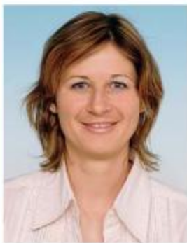
Piše: mag. Leja Drogenik Štibelj

delitve dobička 1 se prenesejo v vzajemne sklade (fra. Fonds communs de placement d'entreprise – FCPE ), ki jih običajno upravljajo družbe za upravljanje s sredstvi, ki so podružnice bank ali zavarovalnic, tako da vlagajo sredstva v delnice ali obveznice družbe delodajalca ali v druge družbe.