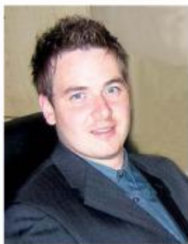
Piše: Mitja Gostiša

dellitev nekaterih dosedanjih vlad 2 . To je vsekakor pozitivno, vendar pa še nismo tako daleč, da bi si pod tem pojmom predstavljali vsi isto.