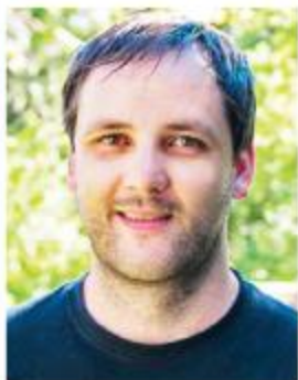
Piše: Marko Funkl