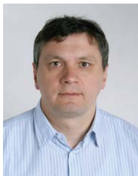
Piše: Janez Mirkac

Svet delavcev Johnson Controls – NTU d.o.o. Slovenj Gradec