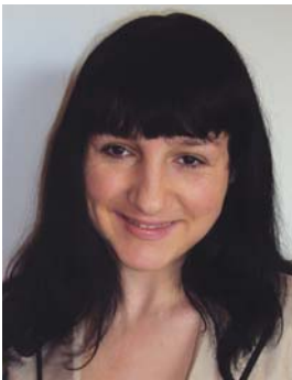
Piše: dr. Janja Hojnik

delovanje tudi svetov delavcev kot osrednjih delavskih predstavništev, s čimer bo – glede na to, da zakon posebej ureja tudi najmanj tretjinska delavska predstavništva v organih zavodov (t. j. svetih javnih zavodov z neomejeno odgovornostjo v oz. NS javnih zavodov z omejeno odgovornostjo) – vsaj v javnih zavodih lahko vzpostavljen sistem delavskega soupravljanja, ki bo skorajda v celoti primerljiv s tistim, ki je zdaj že uveljavljen v gospodarskih družbah. Ni sicer jasno zakaj obvezno sodelovanje delavcev ni določeno tudi za organe zasebnih zavodov, ki bodo določeni z ustanovitvenimi akti teh zavodov (pa kakršni koli že bodo in kakor koli že se bodo imenovali), a vsaj možnost oblikovanja svetov delavcev naj bi veljala za obe vrsti zavodov.