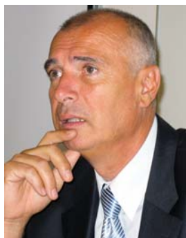
Piše: dr. Mato Gostiša

Združenje svetov delavcev Slovenije (2009) Programski manifest ZSDS: Za sodobno ekonomsko demokracijo namesto mezdnega kapitalizma . Ekonomska demokracija , št. 6, str. 3. ŠCID. Kranj.