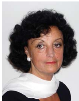
Piše: mag. Cvetka Peršak

Za napredek so potrebne bistvene sistemske spremembe